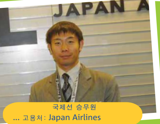
국제선 승무원 ... 고용처: Japan Airlines