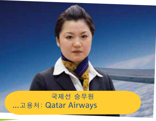
국제선 승무원 ... 고용처: Qatar Airways