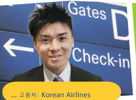
... 고용처: Korean Airlines